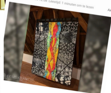
Diverse artikelen in de media

24 september 2025 12:08 Leestijd: 1 minuten om te lezen AA