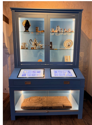
Vitrinekast met touchscreens