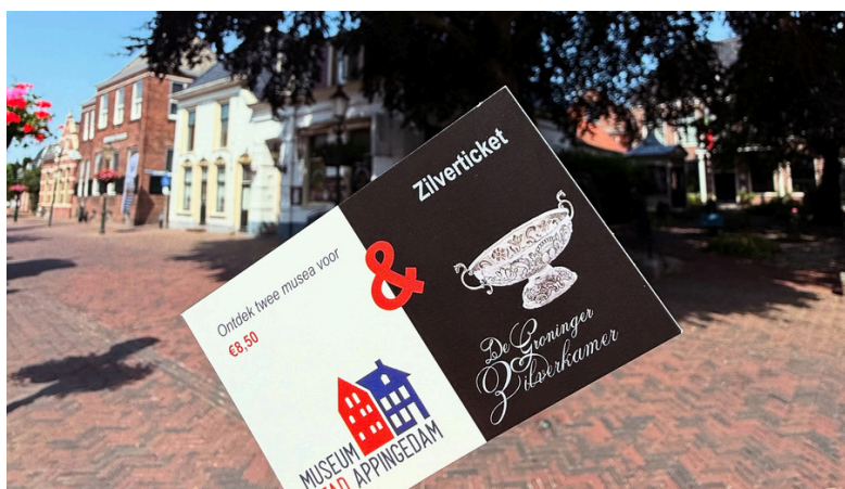
Combi-ticket Groninger Zilverkamer en MSA