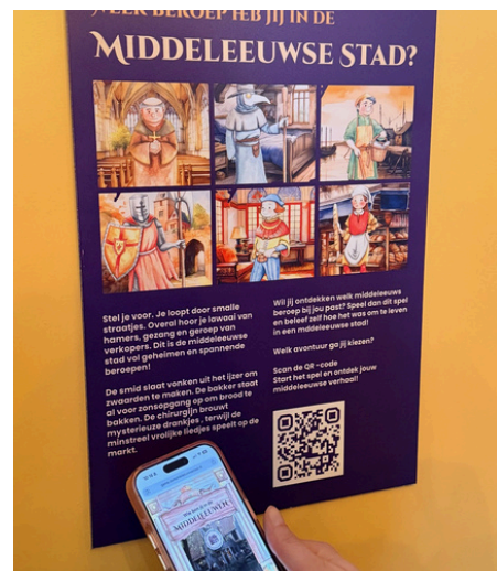
Digitale game Middeleeuwse stad