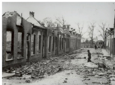
Enorme schade aan de huizen aan de Harmoniestraat in Appingedam.

2 april 2025 10:59 Leestijd: 1 minuten om te lezen AA