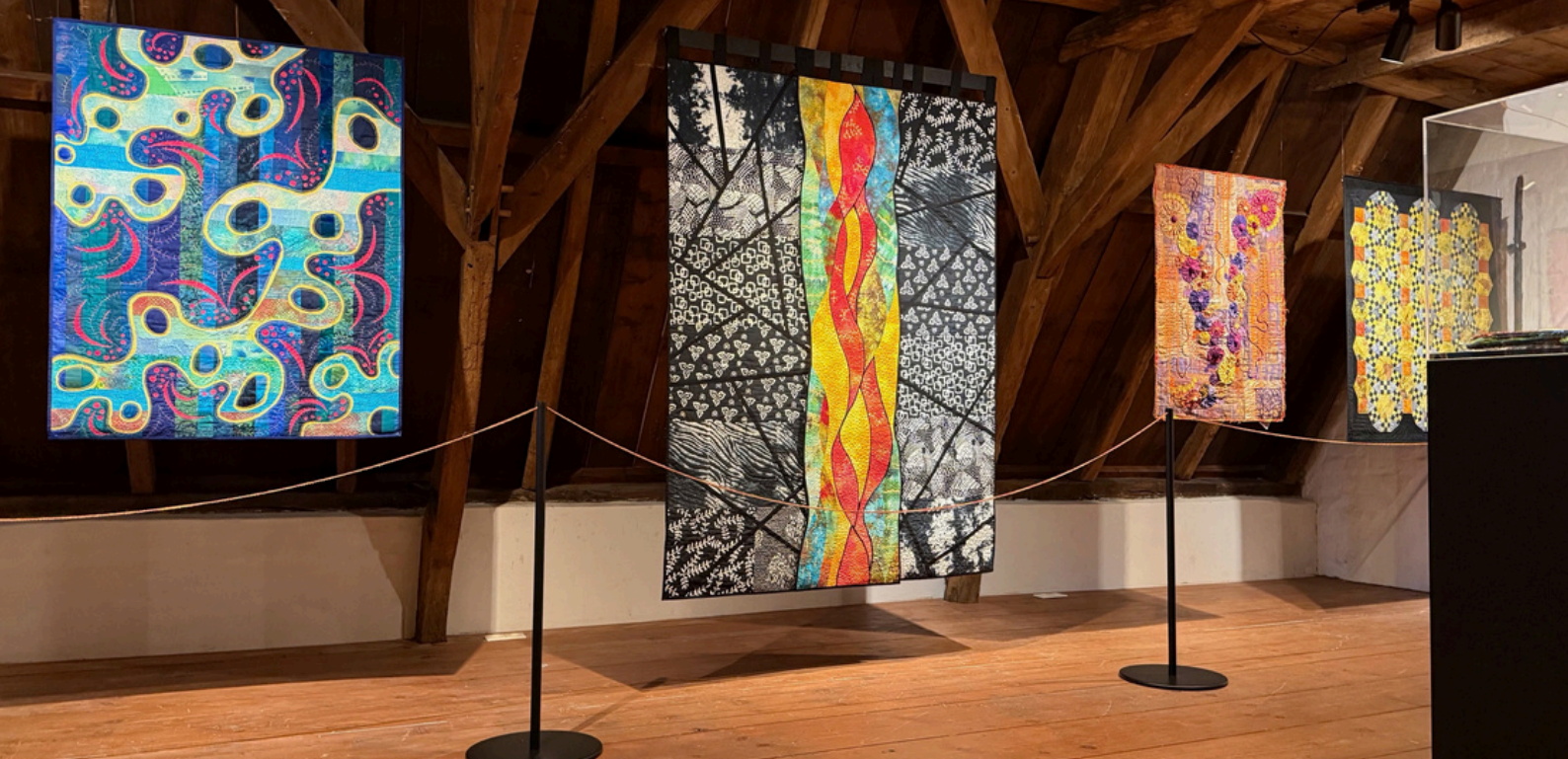
Expositieruimte MSA Jouv Museum

Appingedam was een van de laatste slagvelden in Nederland. Terwijl de geallieerden oprukten naar Delfzijl, werd de stad zwaar getroffen door gevechten en beschietingen. In deze tentoonstelling wordt de bezoeker meegenomen door de belangrijkste gebeurtenissen: van het dagelijkse leven in oorlogstijd en de angstige dagen van evacuatie tot de uiteindelijke bevrijding.