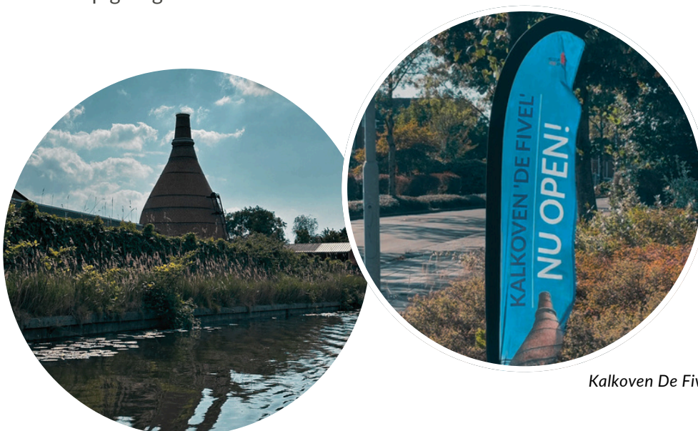
Kalkoven De Fivel

In 2025 is met de gemeente gesproken over het verbeteren van de toegankelijkheid van de kalkoven, door de aanleg van een apart toegangspad, zoals ook voorzien was bij de restauratie. Door de herstructurering van de gemeentewerven is de uitvoering van dit plan helaas voorlopig uitgesteld.