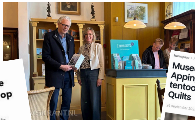
Uitreiking nieuw magazine Marketing Eemsdelta

Sinds 2025 adverteren we ook in het regionale tijdschrift Blad en in Dasjagoud. Daarnaast zijn we lid geworden van Marketing Eemsdelta, wat zorgt voor vermelding in het magazine. In het museum is een display ingericht met folders, plattegronden en aanvullende informatie.