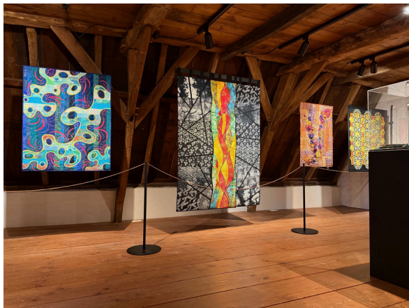
Vernieuwde expositieruimte MSA Jouv Museum