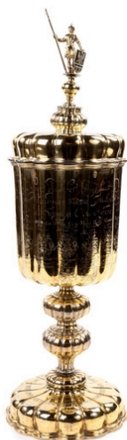
Pronkbokaal Generale Zijlvest der Drie Delfzijl, Jan Mettinck ca. 1660

Museum Stad Appingedam werkt ook mee aan Collectie Groningen. Sinds de lancering in november 2025 zijn 1442 objecten uit de collectie en 12 verhalen te bekijken op de website Collectie Groningen. Daarnaast zal de collectie ook op de eigen website toegankelijk zijn. De informatie over de collectie zal eveneens via touchscreens in de nieuw te realiseren vitrinekasten, onderdeel van het vernieuwingsprogramma te zien zijn.