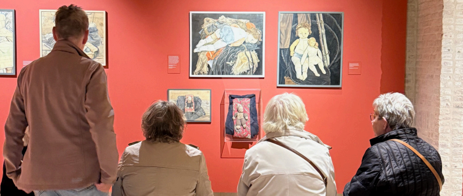
Vrijwilligersuitje naar het Jopie Huisman museum