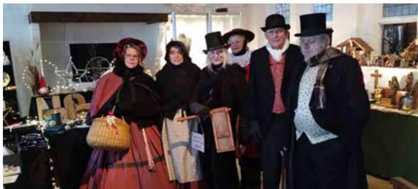
Dickens in Daam bezoekt de kerstfair in het museum

December stond weer als vanouds in het teken van feestelijkheden: na sinterklaasavond werd het museum gedecoreerd in Dickensstijl en halverwege december werd een Kerstfair en kaarslichtavond gehouden in het museum.