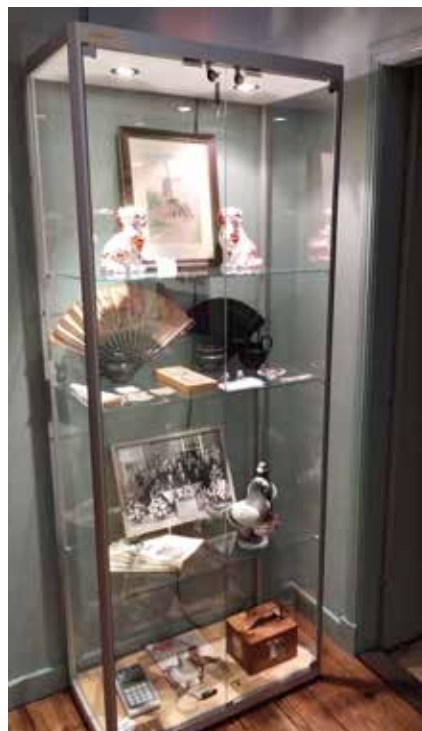
Vitrine op de tentoonstelling 'Van papier tot ping'

Voor de tentoonstelling zijn diverse bruiklenen verkregen, onder andere van de Kentalis Guyotschool in Haren, voor kinderen met een meervoudige communicatieve beperking. Van dit instituut mocht het museum meerdere objecten lenen die de communicatie vergemakkelijken, zoals een buzzer die je onder je matras kunt leggen als wekker en een braille-typemachine. Daarnaast waren er bruiklenen van het Hoogeland Museum te Warffum, het Veenkoloniaal Museum en het Kapiteinshuis te Oude Pekela, het MuzeeAquarium te Delfzijl en een aantal particuliere bruikleengevers. Voor kinderen was een gedeelte van de expositie ingericht met een klein postkantoorje oude stijl en een echte typemachine. Waarvan een jongen tegen zijn opa zei: 'Kijk opa, dat is nog eens handig, dan heb je geen printer meer nodig!', dus opa had wat uit te leggen. Kentalis is