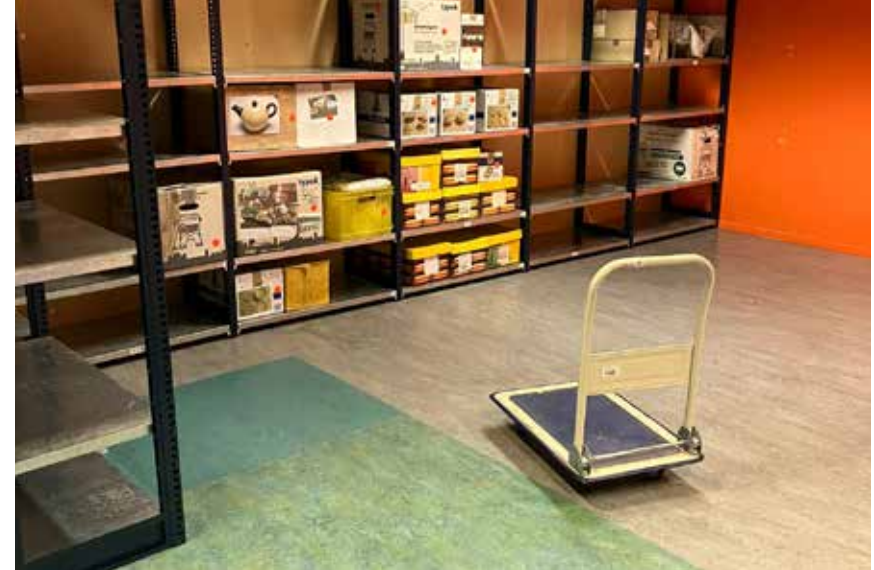
Het nieuwe depot