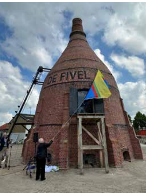
Opening kalkoven 2023