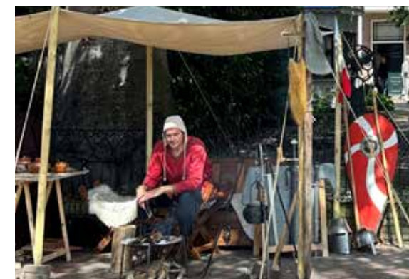
De 'Koeckenbackers' voor het museum op de Coopluydenmarkt