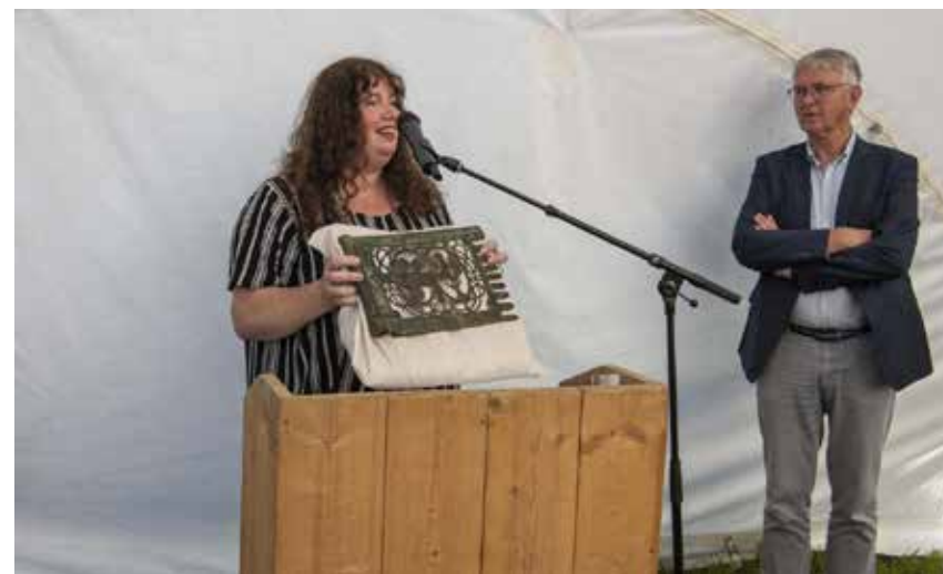
Kerkje Jukwerd boekpresentatie en overhandiging windvaan

Het verhaal van Appingedam, dat aan de hand van de collectie verteld kan worden, is een bijzonder onderdeel van het verhaal van Groningen: naast Groningen is Appingedam de enige stad van middeleeuwse oorsprong. Dit stadsverleden maakt het museum uniek en wordt het speerpunt van de nieuwe collectiepresentatie 'Wat een stad'.