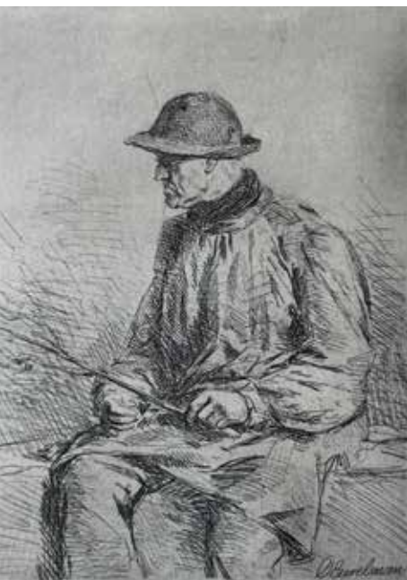
Prent van een boerenknecht, Otto Eerelman

In 2023 bestond het team van betaalde medewerkers uit een collectiemedewerker, een junior-conservator, een managementassistent/projectmedewerker en een directeur. Aan het einde van het jaar is de collectiemedewerker gestopt met haar werkzaamheden voor het museum en haar taak, met een omvang van 8 uur, is voorlopig overgenomen door de andere medewerkers en vrijwilligers. Naast de vaste medewerkers heeft het museum 35 vrijwilligers in dienst: zonder hen zou het museum niet opengesteld kunnen blijven voor publiek. Vrijwilligers vervullen de baliediensten, doen het klein onderhoud en de tuin, zijn gastvrouw/gastheer bij ontvangsten en openingen van tentoonstellingen, geven rondleidingen en houden zich bezig met de collectie en het inrichten van de tentoonstellingen.