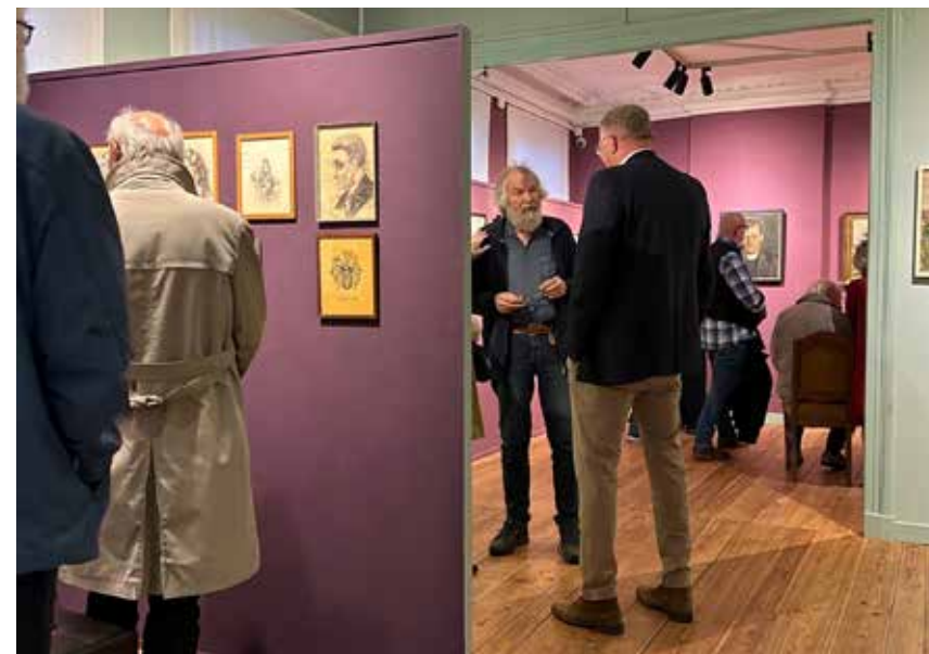
Impressie van de tentoonstelling 'Damster schilders'

In het najaar is de tentoonstelling 'Damster schilders in de schijnwerpers' geopend, door collega Rob Möhlmann van het gelijknamige museum in Appin-