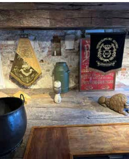
In het midden de stembus in het museum

In januari is een podcastserie gemaakt over 'Het verhaal van Groningen', waarbij historicus Beno Hofman opnames heeft gemaakt in het steenhuisgedeelte van het museum. RTV-noord heeft deze podcast vervolgens uitgezonden.