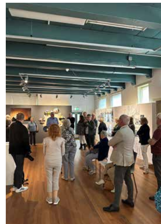
Vrijwilligers, medewerkers en bestuursleden op werkbezoek aan het Museum te Dokkum