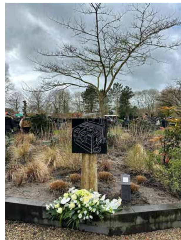
Het monument op de begraafplaats 'Rusthof' met het bordje met de QR-code

Daarnaast is de website een belangrijk medium: deze fungeert ook als verzamelpunt van kleinere cultuurhistorische organisaties binnen Appingedam, zoals het Damster Klokkenspel, het Archeologisch Informatiepunt Oost-Fivelingo en informatie over de van oorsprong Damster professor Rudolph Pabus Cleveringa. In 2023 werd een onderdeel toegevoegd aan de website: de informatie over de Molukse graven in Appingedam. Aan deze graven werd in 2023 een bijzondere status verleend: de gemeente Eemsdelta committeerde zich aan het onderhouden van deze graven en beloofde dat deze hun plaats zouden behouden, als eerbetoon aan de bewoners van de eerste Molukse wijk in Nederland, die begin jaren '50 werd gerealiseerd in Appingedam. De gemeente heeft vervolgens het museum gevraagd een QR-code aan te leveren die te scannen is op de begraafplaatsen 'Rusthof' en 'Stilleweer' en doorlinkt naar de informatiepagina op de website van het museum.