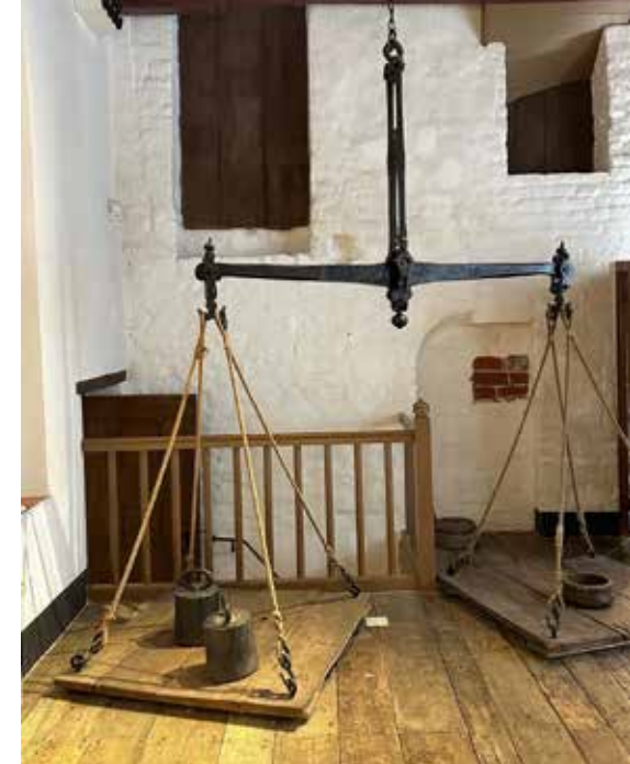
De waag die in de 17e eeuw cruciaal was voor de handel in Appingedam

In het begin van het jaar werd de expositie 'Van papier tot ping' geopend. Deze tentoonstelling belichtte de vele facetten van communicatie door de eeuwen heen: het doorgeven van boodschappen. Rooksignalen, postduiven, brieven en telegrammen, de telefoon en de radio en het eindigde bij een inmiddels museaal mobiel telefoontoestel.