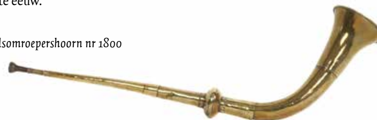
Stadsomroepershoorn nr 1800

Juist het stadsverleden van Appingedam leverde een paar bijzondere vormen van communicatie op: de stadsomroeper bijvoorbeeld, een eeuwenlange traditie waaraan een grote messing hoorn in de museumcollectie nog herinnert. Later kondigde de stadsomroeper zijn boodschap aan met een grote handbel, eveneens onderdeel van de collectie. De stadsomroeper en zijn vrouw zijn vereeuwigd op een schilderij van Jan Stuijver, een bekend Damster schilder uit de 20ste eeuw.