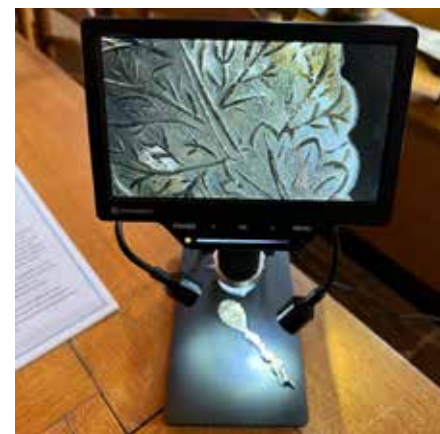
Publieksdag microscopie 2023

In november heeft het museum meegedaan aan de Dag van de microscoop, georganiseerd door de Rijksuniversiteit Groningen. Bezoekers konden door de microscoop – die eigenlijk een monoscoop was – bijvoorbeeld merken ontwaren in een zilveren lepel, of minuscuul borduurwerk bekijken. Het verschil is, dat je met een microscoop alleen hele dunne preparaten tussen glaasjes kunt bekijken, maar met dit apparaat kon je een vast voorwerp uitvergroten. Bezoekers vonden het wel leuk en wij ook, want wij mochten het apparaat houden na afloop.