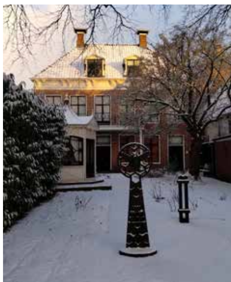
Het museum in kerstfeer