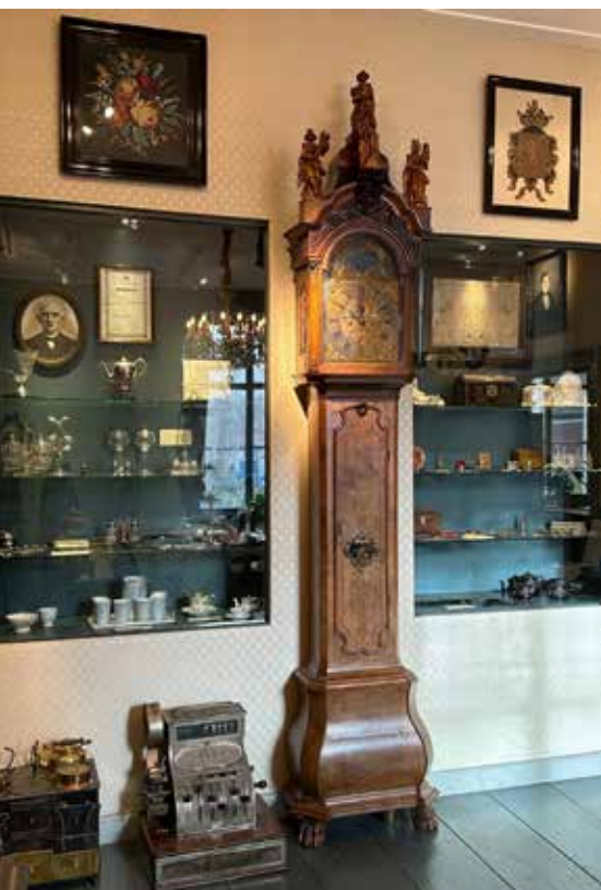
Het staand horloge van Oortwijn in de 19e-eeuwse stijlkamer

De collectie omvat ruim 10.000 objecten die representatief zijn voor de cultuurhistorie van de stad Appingedam en de regio Fivelingo. Een deel van deze objecten is gedigitaliseerd. Het museum is in 2021 overgestapt van collectiere-