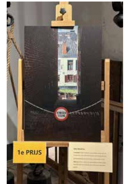
De winnende foto van het steegjesproject