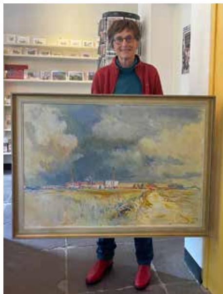
Schenking van het schilderij 'De Eendracht'

Hierop werd wel een uitzondering gemaakt: van het vroegere logement