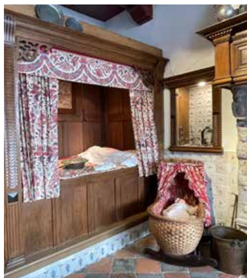
Bedstee in de 17e-eeuwse kamer