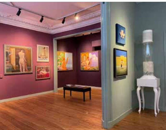
Expositie Net Naakt