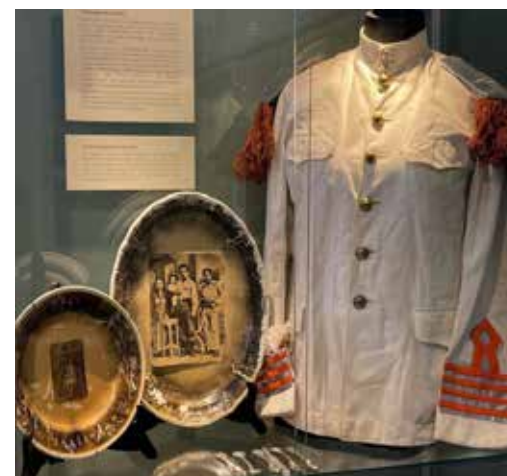
Indruk van de tentoonstelling