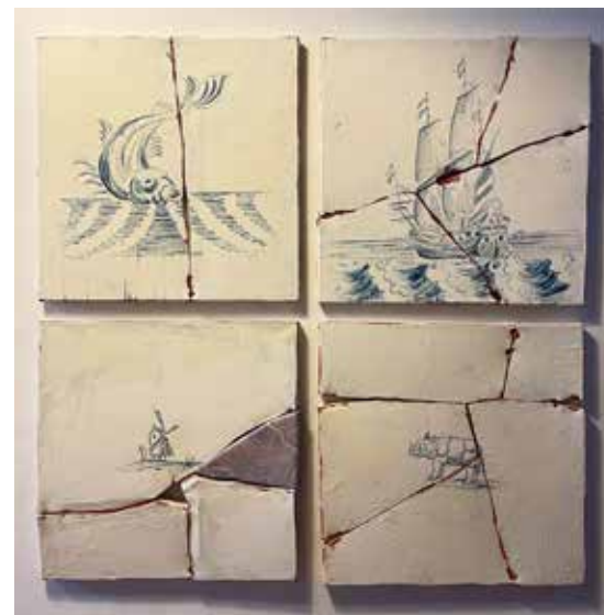
Het kunstwerk 'Bewährtes' van Timo Grimm

In de laatste maanden van 2022 kreeg het museum de kans om de ambtskettingen van de gemeente Eemsdelta te exposeren. Als stadsmuseum zijnde, heeft het museum ook de schone taak om het zilver dat uit de stad en de streek