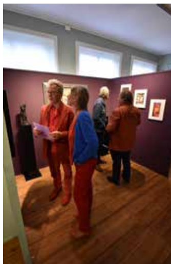
Impressie expositie Net Naakt

de zijn de panelen en sommige objecten verhuisd naar de Molukse kerk in Appingedam en vervolgens naar het Eemsdeltacollege, waar ze gebruikt worden in de geschiedenislessen.