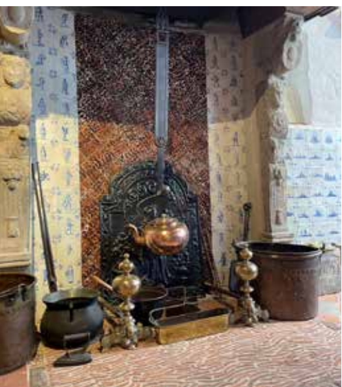
Haard in de 17e-eeuwse kamer