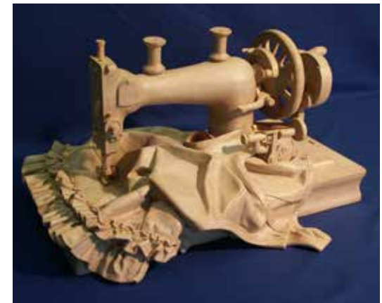
Eén van zijn topstukken