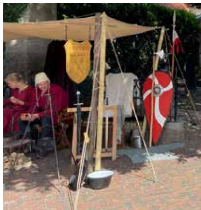
Coopluydenmarkt in augustus

Naast de tentoonstellingen nam het museum dit jaar ook weer deel aan diverse activiteiten, zoals de Nationale Museumweek in april, het Monumentenweekend in september, de wandeltocht Fivelstadtocht die door het museum voerde en de middeleeuwse Coopluydenmarkt in augustus.