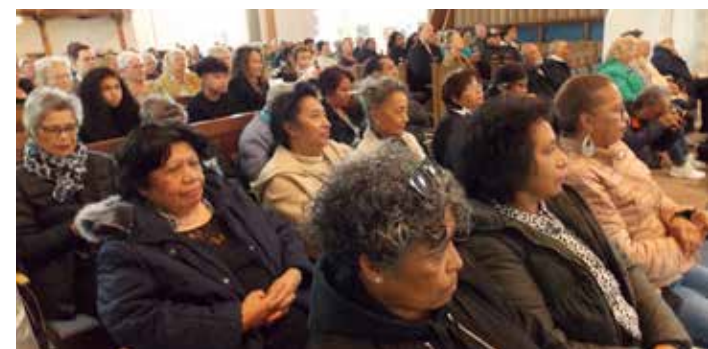
Opening van de tentoonstelling in de Nicolaïkerk Appingedam