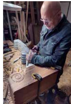
Tico Top aan het werk