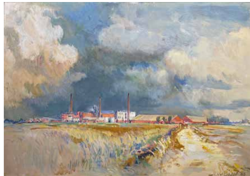
Het schilderij van 'De Eendracht' door Jan Lucas van der Baan

Wildeman in Appingedam kreeg het museum een complete set dienbladen, onderzetteren en servies én een kraantjespot.