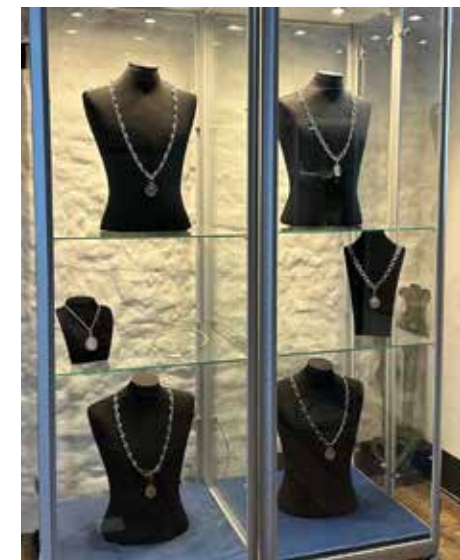
Ambtsketens gemeente Eemsdelta