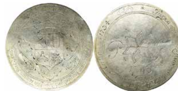
Voor- en achterzijde gildepenny

Het netwerk van het museum bestaat uit lokale contacten binnen de gemeente Eemsdelta – zoals het Cultureel Platform Eemsdelta en het MuzeeAquarium -, maar is ook bovenregionaal. Regionaal maakt het museum deel uit van het door Erfgoedpartners georganiseerde directeurenoverleg, is lid van de Coöperatie Sterke Musea en onderhoudt het museum contacten met het Hoogeland-