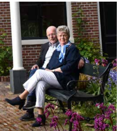
Tico en Aly Top voor het museum