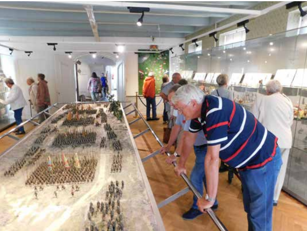
Vrijwilligers tijdens de excursie naar het Nationaal Tinnen Figuren Museum te Ommen.

Het museum heeft als algemeen doel om de cultuur en de historie van de stad Appingedam en de regio Fivelingo te bewaren en te presenteren aan het publiek. Daartoe worden objecten en bescheiden verzameld, die representatief zijn voor dit verleden, die uitnodigen tot nader onderzoek en die voor bezoekers interessant zijn. De collectie neemt een unieke plaats in binnen de Collectie Groningen, doordat het zwaartepunt ligt op de stadsontwikkeling en de bezoekers – na het bezoeken van het museum – met eigen ogen de sporen van de middeleeuwse stad kunnen waarnemen in het oude centrum. Dat het museum gehuisvest is in twee rijksmonumentale panden midden in dit centrum, maakt het een uniek ensemble, geworteld in de historie. In het museum is een vaste presentatie te vinden over deze stadshistorie, die in de komende tijd vernieuwd gaat worden. Naast de vaste presentatie zijn er wisseltentoonstellingen en activiteiten die een thema uit de collectie verbinden met de actualiteit en zo extra de aandacht vestigen op het Gronings erfgoed en het belang daarvan.