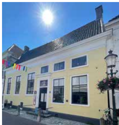
Museum ingang Dijkstraat