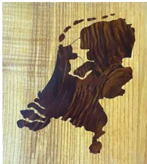
Geschonken door Tico Top aan het museum