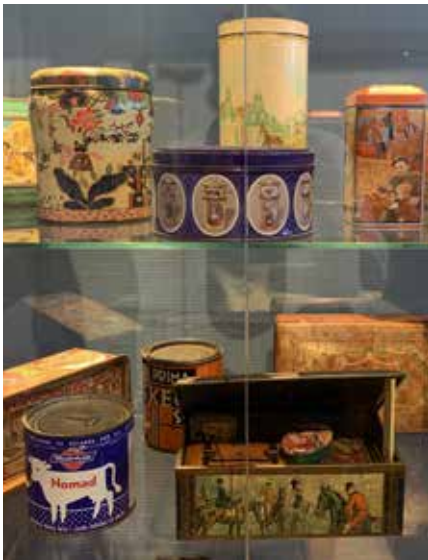
Vitrine tentoonstelling 'Voor het voetlicht'

Toen het duidelijk werd dat de musea per 5 juni open mochten, waren de voorbereidingen voor een volgende expositie al in volle gang: 'Verbinding in beeld', een tentoonstellingsdrieluik dat tegelijkertijd te zien zou zijn in drie musea binnen de nieuwe gemeente Eemsdelta. De tentoonstelling had als doel om inwoners maar ook toeristen te laten zien dat de drie voormalige gemeentes Loppersum, Appingedam en Delfzijl eigenlijk al eeuwenlang verbonden zijn: door het landschap, de bevolking, de cultuur en de beeldende kunst. Juist die kunst verbeeldt de verbinding heel duidelijk: landschappen, kerken, stads- en dorpsgezichten: herkenbaar en eigentijds, maar ook historisch van bijvoorbeeld schilders van de Groninger Kunstkring De Ploeg. De tentoonstellingen werden ingericht door een gastconservator, Arenda Ubbens.