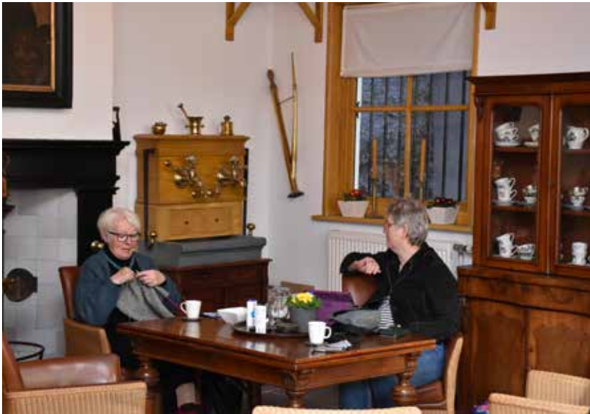
Vrijwilligers in de ontvangstruimte van het museum