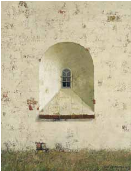
Venster kerk van Marsum, geschilderd door Henk Helmantel