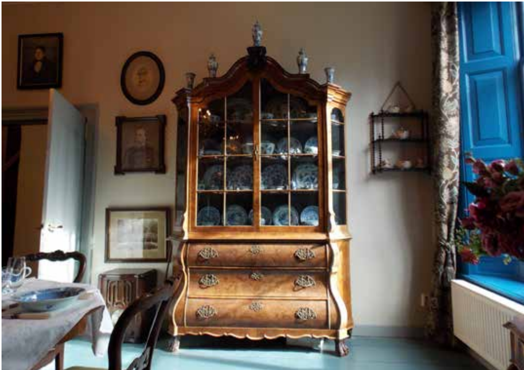
De 19e-eeuwse stijlkamer

Een werkbezoek aan een collega-museum was dit jaar niet mogelijk, maar in oktober kon gelukkig een etentje met alle vrijwilligers worden georganiseerd. De vrijwilligers en medewerkers hebben dit gebaar van het bestuur bijzonder gewaardeerd.