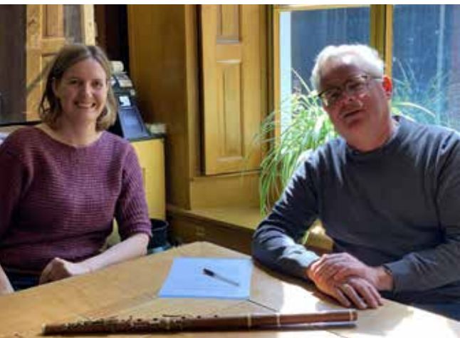
Overdracht traverso aan het Hoogeland Museum

het museum opgesteld, die gestart was in 2020. Hier waren winterse schilderijen van Harry Meerveld te zien, een Groninger schilder die zich heeft gespecialiseerd in winterlandschappen. Verder waren er winterse foto's en taferelen met oude sledes, koek en zopie en alles wat met historische winters en de traditie van het schaatsen te maken heeft.