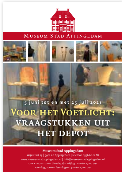
Flyer tentoonstelling 'Voor het voetlicht'