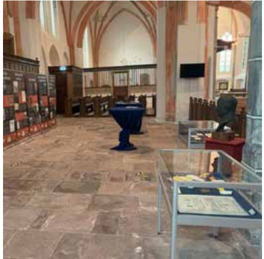
Tentoonstelling over prof. R.P. Cleveringa in de Nicolaïkerk