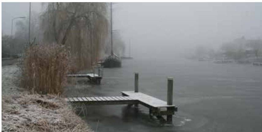
Een echt winterse foto van het Damsterdiep

In de eerste periode van 2021 stond de tentoonstelling 'Echt winters' nog in