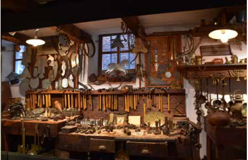
De koperslagerij in de Houwerzijlkelder

In de tabel is te zien dat met name in de zomerperiode het aantal museumkaarthouders toenam. Het percentage betalende bezoekers is gestegen ten opzichte van de jaren vóór corona, omdat de evenementen met vrij toegang niet door konden gaan.