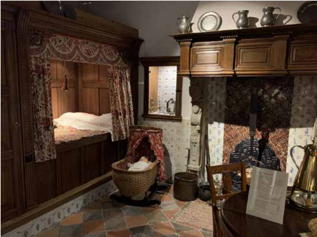
De 17e-eeuwse stijkkamer

Het verhaal van Groningen kan niet worden verteld zonder de geschiedenis van de middeleeuwse stad Appingedam. Museum Stad Appingedam zet haar collectie in om deze geschiedenis onder de aandacht van het publiek te brengen, te onderzoeken en te bewaren voor latere generaties. In 2021 zijn de plannen voor een nieuwe vaste opstelling verder ontwikkeld en is er gewerkt aan een bidbook voor een totale update van het museum. Het project is omvangrijk: het beslaat ook de tuin van het museum en in principe alle vertrekken. Het belangrijkste uitgangs-