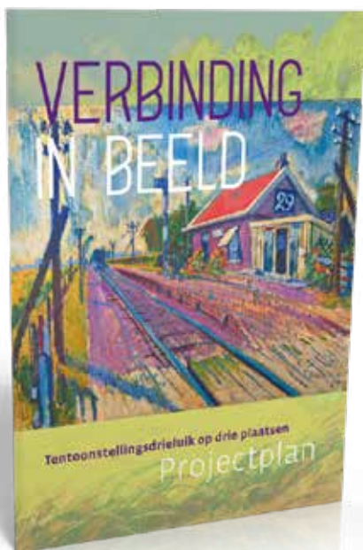
Projectplan 'Verbinding in beeld'

In de periode dat we gesloten waren, hebben we geprobeerd ons publiek vast te houden door een extra dikke 'bewaarnieuwsbrief' met interessante artikelen uit te brengen en door online activiteiten en filmpjes te publiceren via social media. In de periode dat we wel weer bezoekers mochten ontvangen, hebben we groots uitpakkt met het tentoonstellingsproject 'Verbinding in beeld' dat geopend werd in de Nicolaïkerk, waar ruim 200 man aanwezig waren. Dat voelde als een verademing na de lockdown.