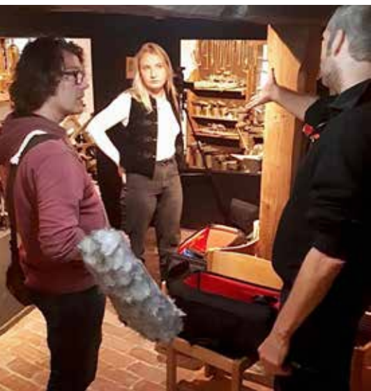
Opname voor project over ambachten van de Groninger Archieven

Naar aanleiding van het nieuwe jaarplan en een aangepaste begroting heeft de provincie alsnog besloten de meerjarige cultuursubsidie toe te kennen.