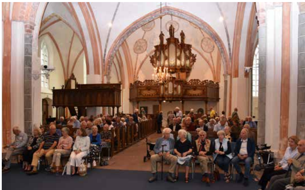
Opening van de tentoonstelling 'Verbinding in beeld' in de Nicolaïkerk te Appingedam

Gelukkig heeft het museum dankzij subsidies en donaties het jaar toch positief af kunnen sluiten.