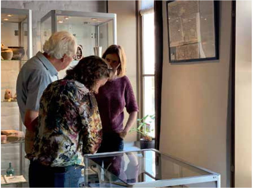
Bezoekers in het museum

de directeur. Het bestuur heeft ook jaarlijks overleg met haar subsidieverstrek- kers. Museum Stad Appingedam biedt bezoekers de mogelijkheid zich te ver- diepen in de kennis over de historie van de stad Appingedam en het omliggende platteland.