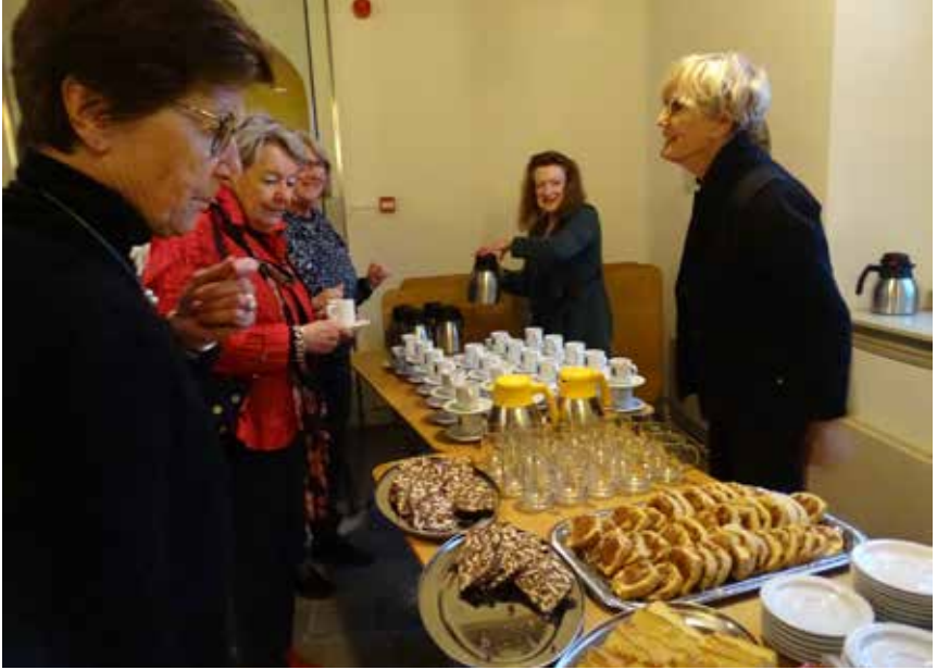
Vrijwilligers verzorgen koffie en thee tijdens een expositieopening

Het bestuur van het museum bestond in 2021 uit zes personen en heeft in het afgelopen jaar vijf keer vergaderd. Vanwege de geldende corona-maatregelen vond de vergadering meestal online plaats via Teams.