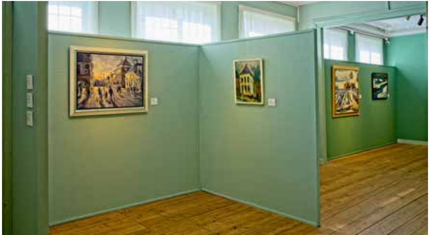
Expositie Verbinding in beeld